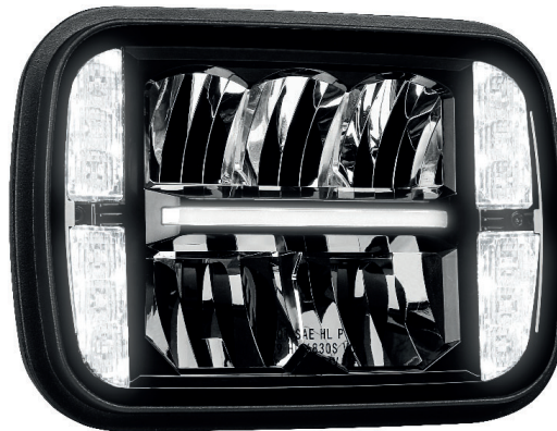
Feux de jour intégrés