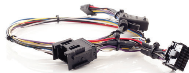
Harnais à connexion rapide disponible pour les véhicules Ford et Nissan