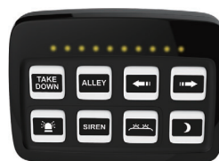
PANNEAU DE CONTRÔLE 8 BOUTONS